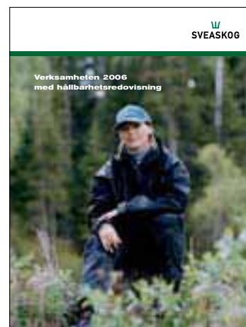
Verksamhetsberättelse med hållbarhetsredovisning.

Sveaskog ger för 2006 ut två publikationer, verksamhetsberättelse med hållbarhetsredovisning samt årsredovisning. Dessa finns som webbversion och som pdf på www.sveaskog.se