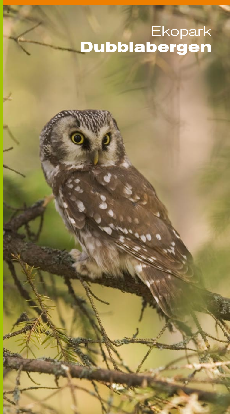
West Studios • Foto: Jörgen Wiklund/Naturfotograferna och Sveaskog • Tryck: Åtta45 Tryckeri AB • Juni 2007

För mer information: www.ekopark.se , www.sveaskog.se eller Sveaskogs kundcenter 0771-787 100 Skogsäventyret: www.skogsaventuret.se