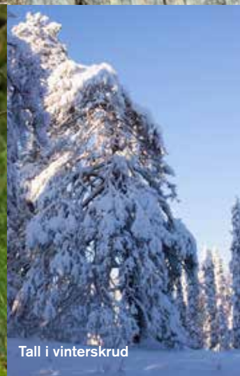
Tall i vinterskrud