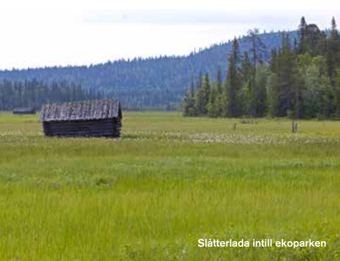
Slätterlador intill ekoparken