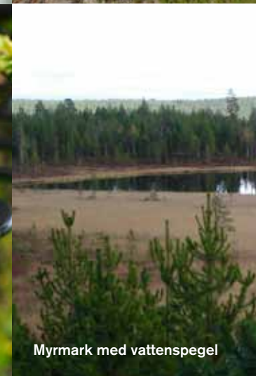
Myrmark med vattenspegel