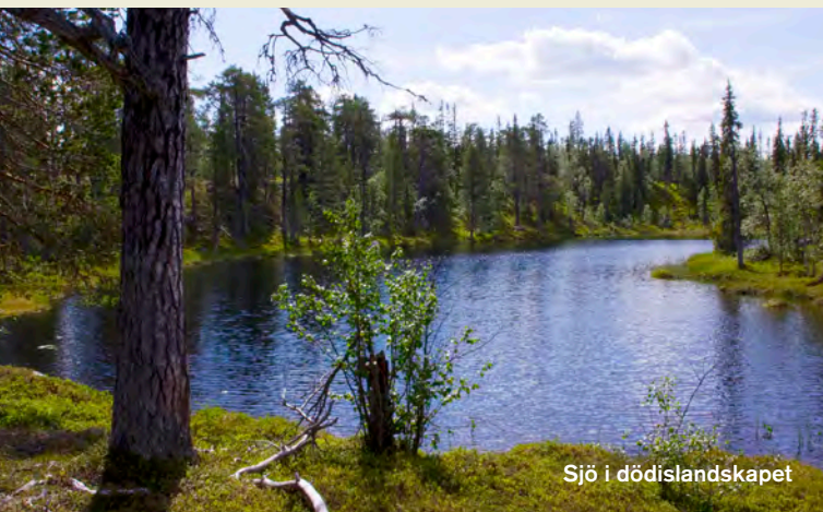
Sjö i dödislandskapet

I natursköna Jokkmokks kommun i Norrbotten ligger Ekopark Luottåive – barnnaturskogarnas och myrmarkernas ekopark. Här finns urskogslika skogar att uppleva, med höga naturvärden och många hotade arter. Orörda delar av skogslandskapet är trolskt vackra. De äldsta tallarna är mer än 500 år gamla, och granarna 300 år. Gammelgranarna är rikligt draperade med hänglav. I naturreservatet breder urskogen ut sig, och här står berget Luottåive 603 meter högt. Det har gett ekoparken sitt namn: "platsen långt bort". Ekoparken är rik på stora myrar och här kan du fylla bärhinken under en uppfriskande skogsdag. På tjärnen kan du njuta av fisketurer, mitt i vildmarkens stilla sus.