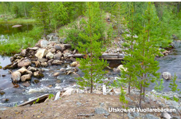
Utskov vid Vuollarebäcken

6 Dödislandskap. I ekoparkens södra del i området kring Granbergstjärnarna finns så kallade dödisområden som bildades när inlandsisen smälte. Karaktäristiskt ligger här moränryggar och mindre sjöar omväxlande tillsammans och bildar ett vackert kuperat landskap.