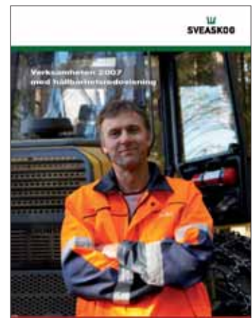
Verksamhetsberättelse med hållbarhetsredovisning.

Sveaskog ger för 2007 ut två publikationer, verksamhetsberättelse med hållbarhetsredovisning samt årsredovisning. Dessa finns som pdf på www.sveaskog.se